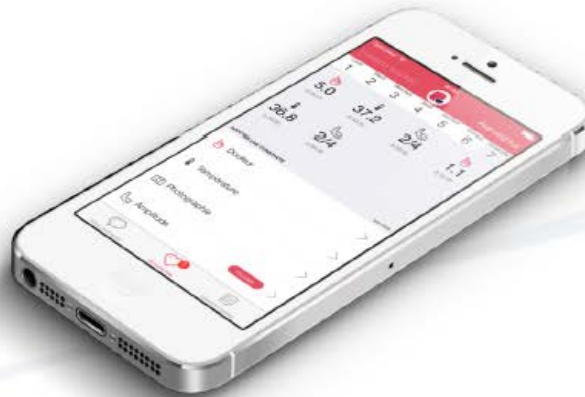
Application mobile pour le patient