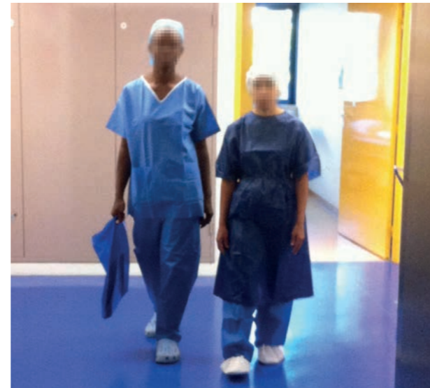
Le transfert du patient se fait à pied, accompagné d'un brancardier, de la salle d'attente d'ambulatoire jusque sur la table d'opération. Le retour se fait sur un brancard.

Par conséquent, soutenir un projet IPSA aujourd'hui, c'est apporter très rapidement des bénéfices aux patients.